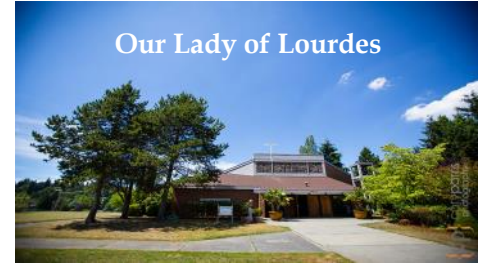
Our Lady of Lourdes